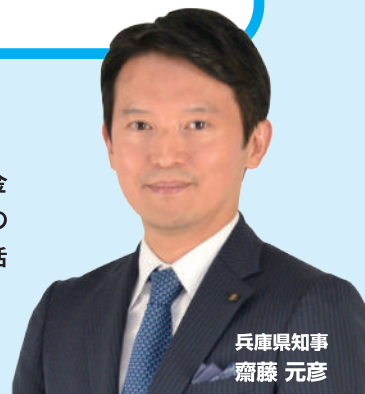
兵庫県知事 齋藤 元彦

兵庫県では6月補正予算を活用し、LPガスを利用されている方々を対象とした料金軽減対策を実施してきましたが、エネルギー価格高騰の長期化を踏まえ、このたびの12月補正予算のもとでも、あらためて対策を講じることとしました。これからも県民生活の安定化に全力を尽くし、誰もが安心して暮らせる兵庫をつくってまいります。